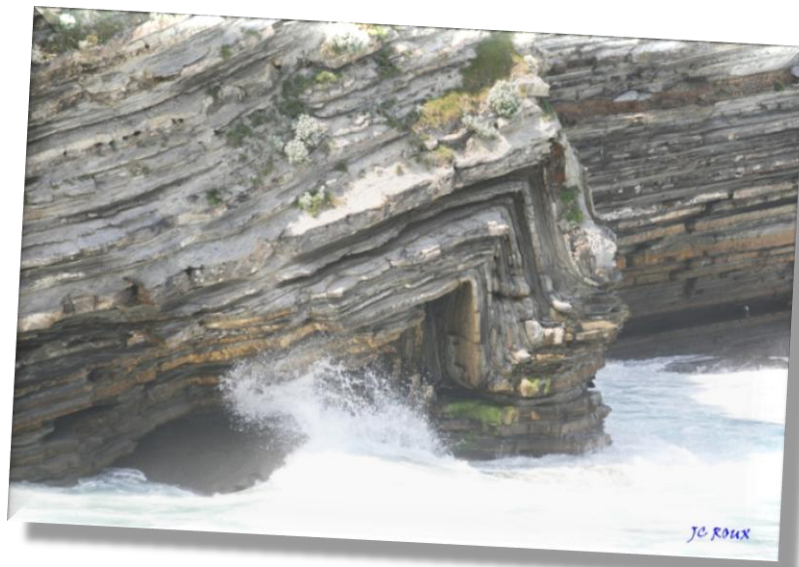
Pli dans les sédiments de la plage des motels basques à Saint-Jean-de-Luz (à l'Ouest la croix d'Arxiloa ou Archilua)

Site internet : http://pierres-pays-basque.364.fr