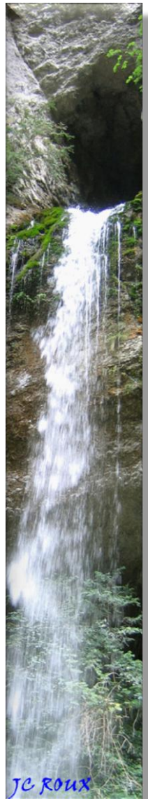
La cascade de Kakouetta